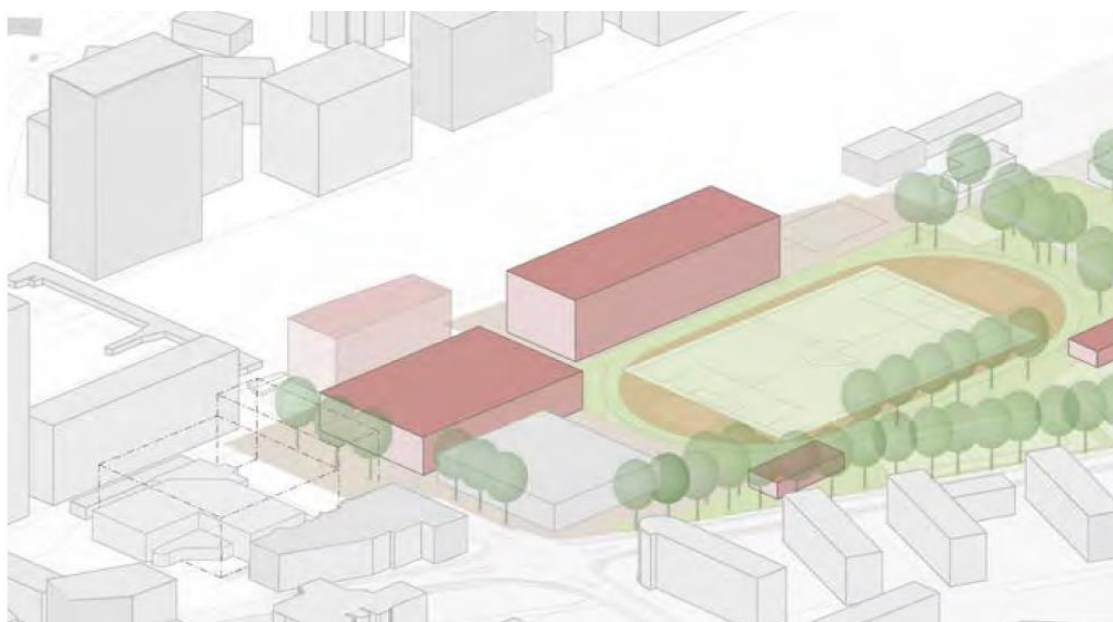
Abbildung aus der Realisierbarkeitsstudie des Bewerbungsdossiers der Gemeinde Risch für den Mittelschulstandort Rotkreuz.