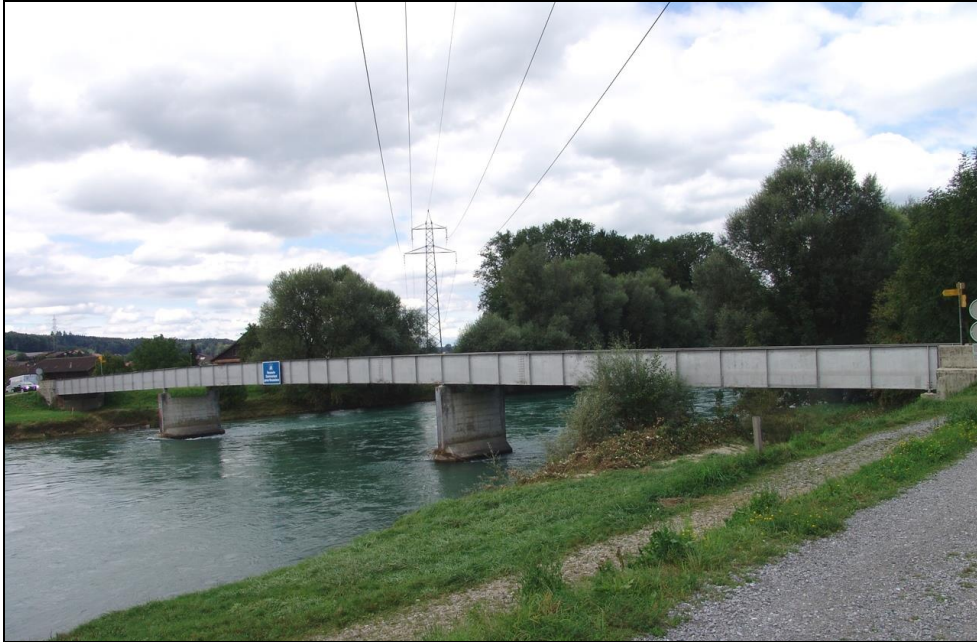
Die Reussbrücke in Mühlau von der Oberwasserseite her fotografiert