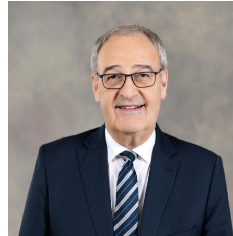
Guy Parmelin Vizepräsident