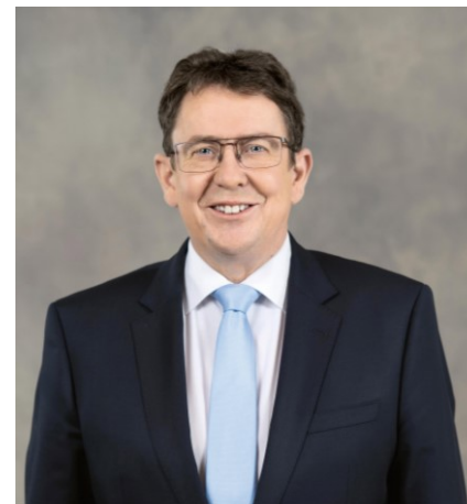
Albert Rösti Bundesrat

Umwelt, Verkehr, Energie und Kommunikation UVEK: