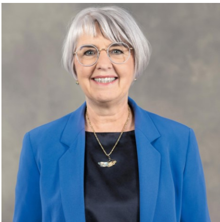
Elisabeth Baume-Schneider Bundesrätin