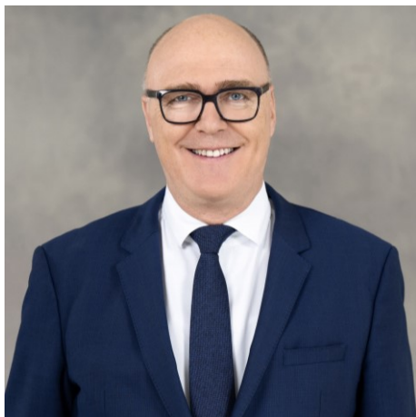
Martin Pfister Bundesrat

Verteidigung, Bevölkerungsschutz und Sport VBS: