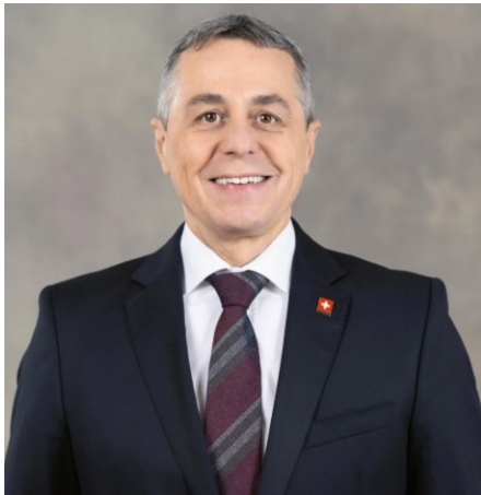
Ignazio Cassis Bundesrat