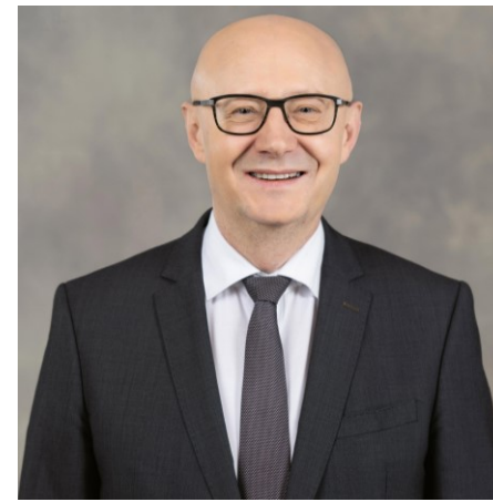
Viktor Rossi Bundeskanzler