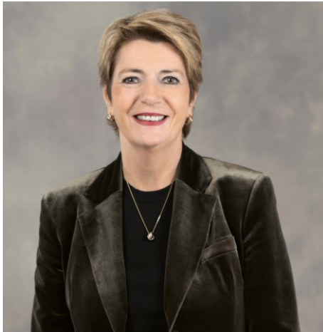
Karin Keller-Sutter Bundespräsidentin