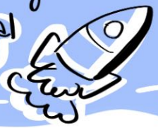
Illustration: Maryna Shchepak

Keeping brands Relevant by closing the GAP Between Generations