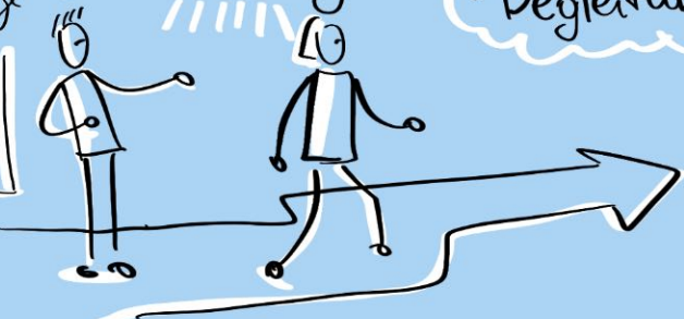
Illustration: Maryna Shchepak