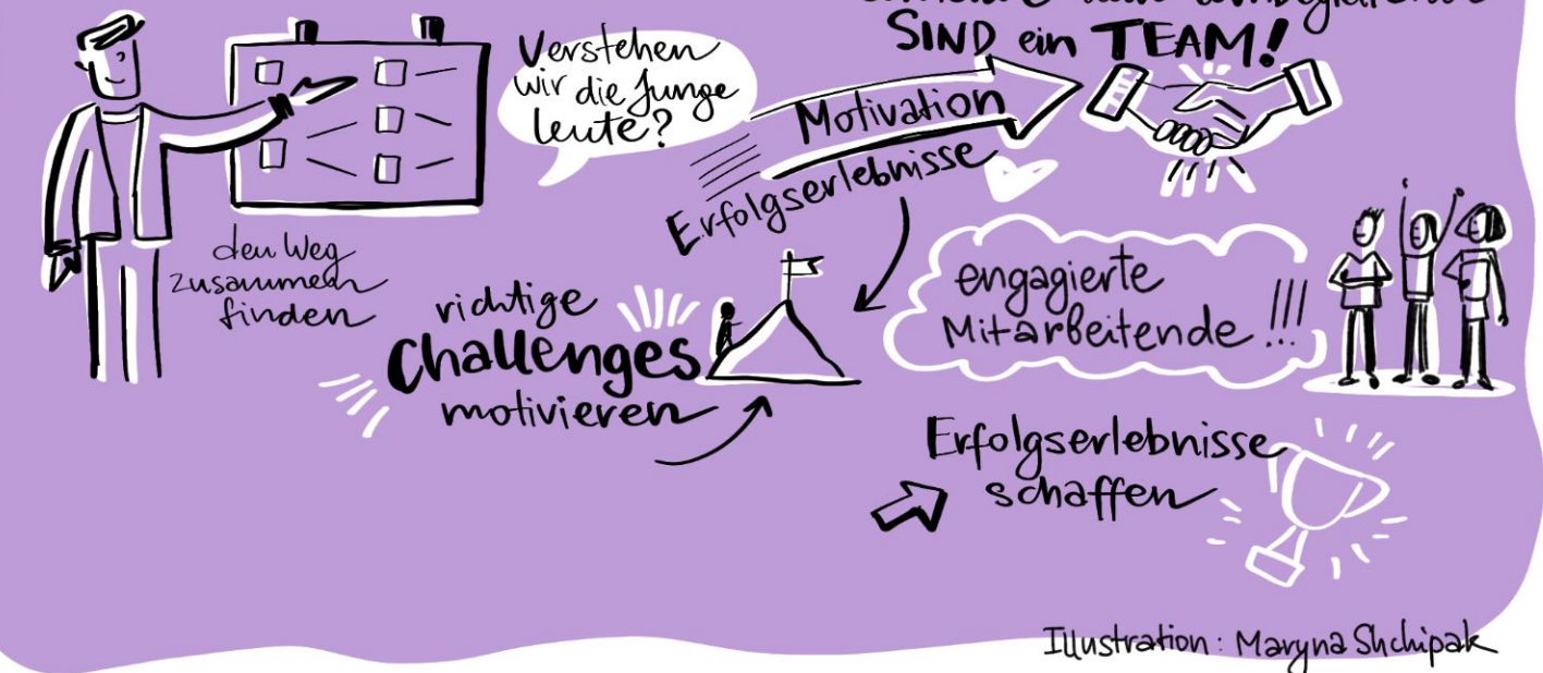
Illustration: Maryna Shchepak