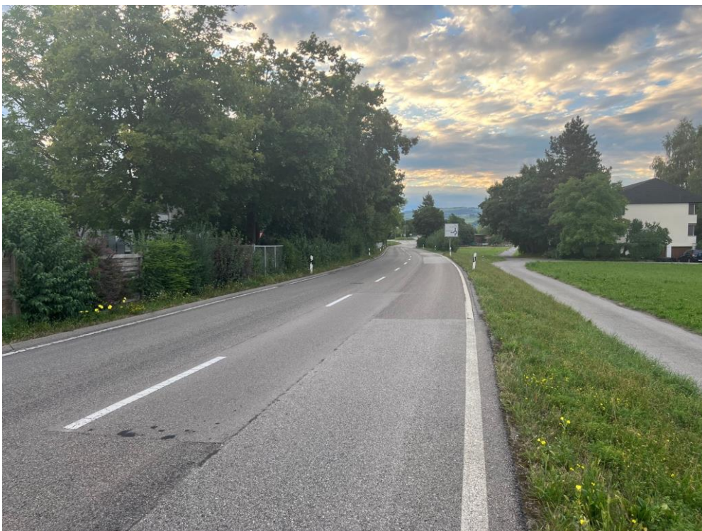
Knonauerstrasse Steinhausen mit Blick in Richtung Kreisel Augasse.