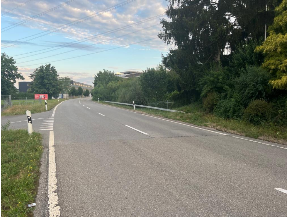
Knonauerstrasse Steinhausen mit Blick in Richtung Kreisel Industriestrasse.