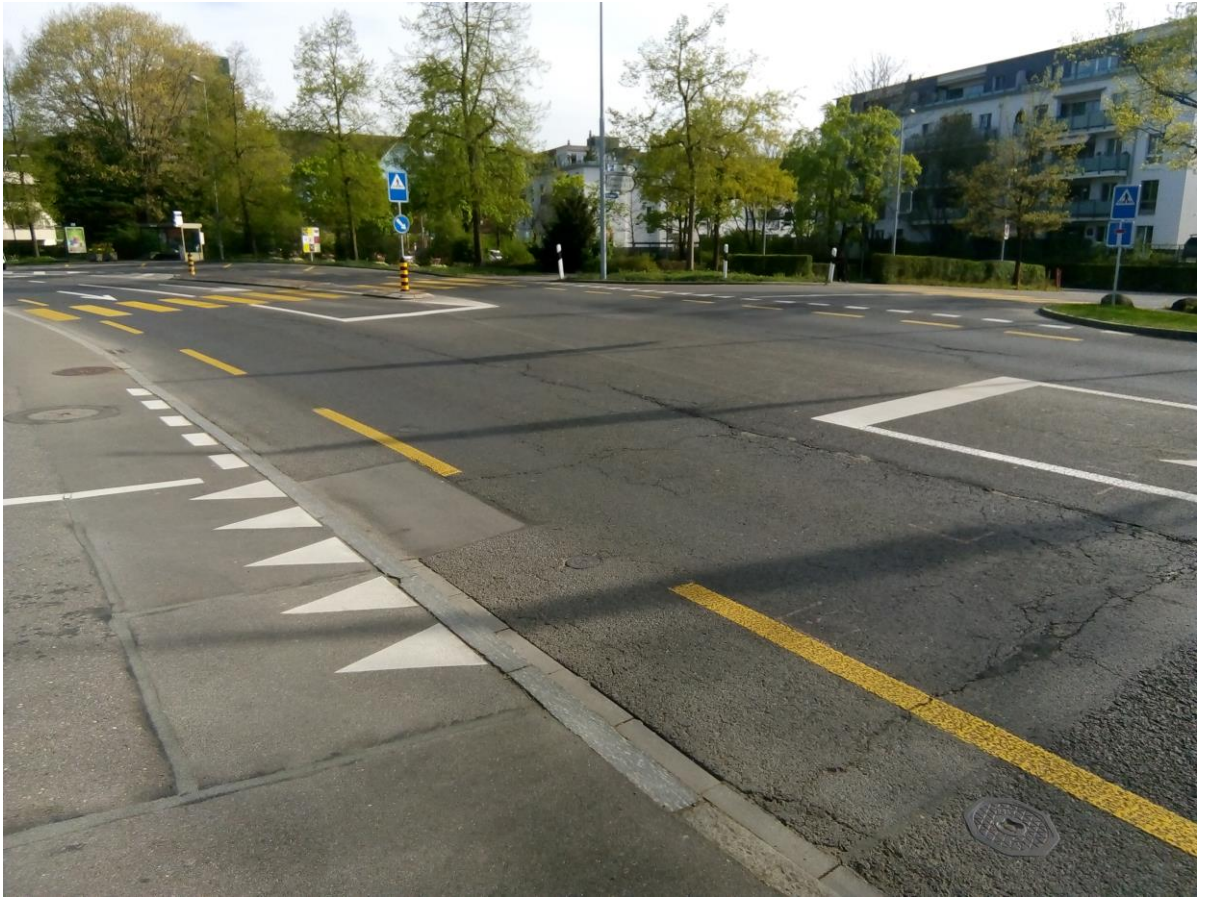
Aktuelle Aufnahme des südlichen Abschnitts der Neugasse in Baar, auf dem Belagsarbeiten vorgesehen sind.