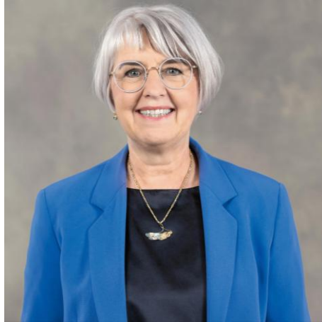
Elisabeth Baume-Schneider Bundesrätin