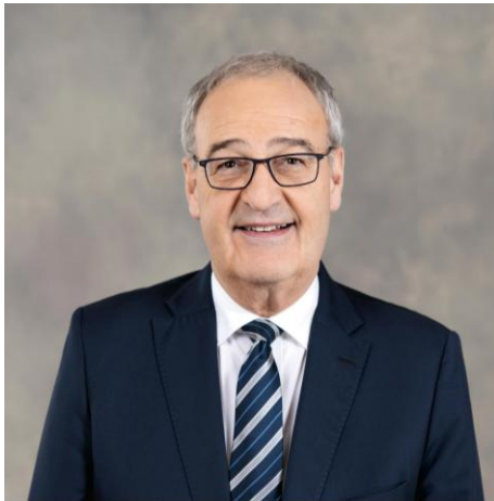
Guy Parmelin Bundespräsident