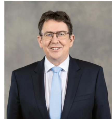
Albert Rösti Bundesrat

Umwelt, Verkehr, Energie und Kommunikation UVEK: