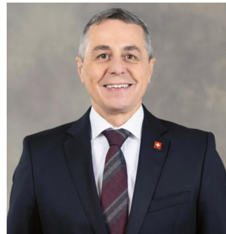
Ignazio Cassis Vizepräsident