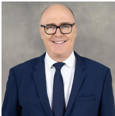
Martin Pfister Bundesrat

Verteidigung, Bevölkerungsschutz und Sport VBS: