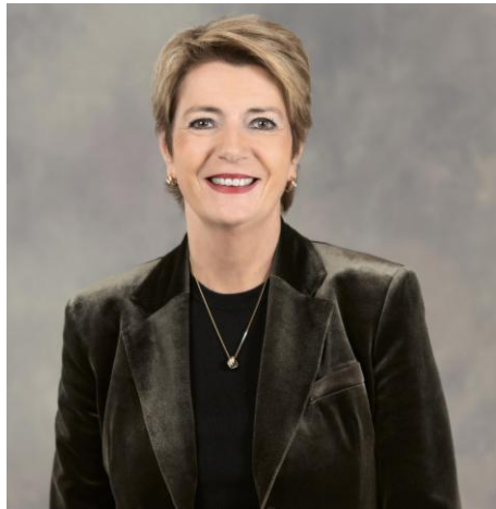
Karin Keller-Suter Bundesrätin