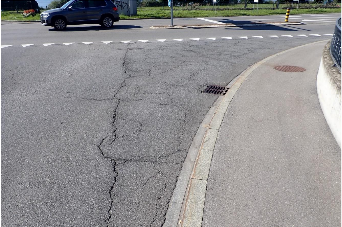
Der Zustand des Strassenbelags im Bereich des Knotens Chamer-/Steinhauserstrasse in Zug bedingt eine entsprechende Sanierung.